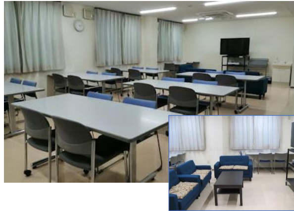
〔談話室(ミニキッチン付)〕

〔1階食堂〕玄関から直結したオープンスペースです。大型テレビ、ソファもあります。