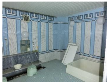
〔浴室・シャワー室〕