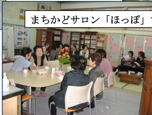
まちかどサロン「ほっぽ」で接客実習