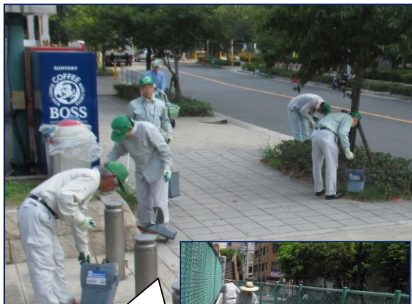
市営住宅や地域・淀川河川敷の清掃